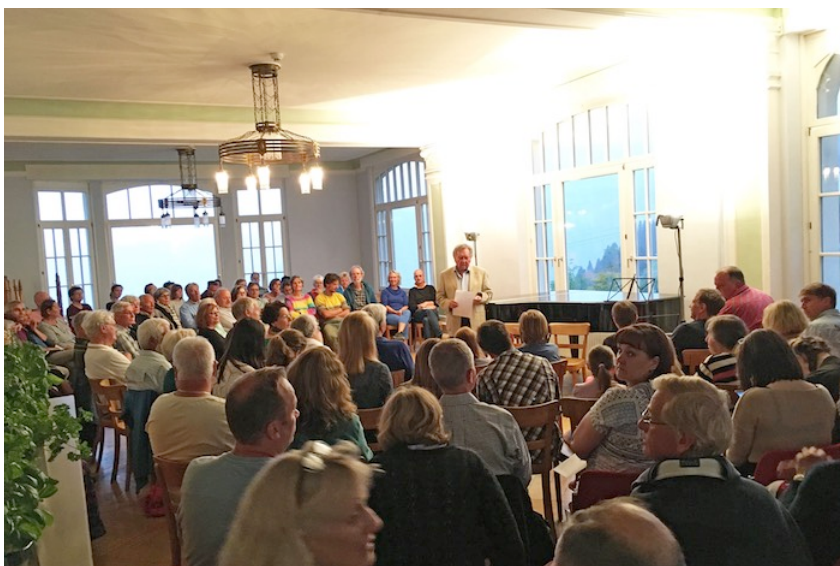
Das erste Konzert am Donnerstagabend war gut besucht. Im Saal des Hotel Regina blieb kein Stuhl frei.