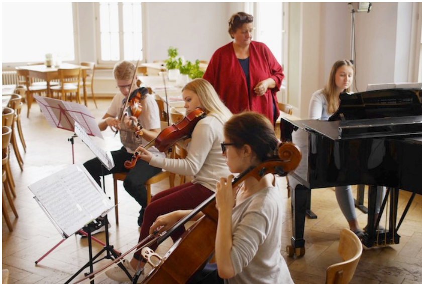
Am Freitagmorgen probte das Klavierquartett Dvorak im Saal des Hotel Regina.